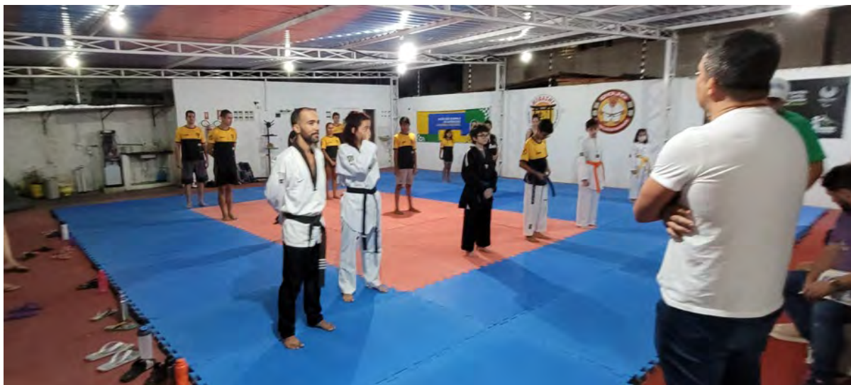
Figura 13 - Atividade de Taekwondo