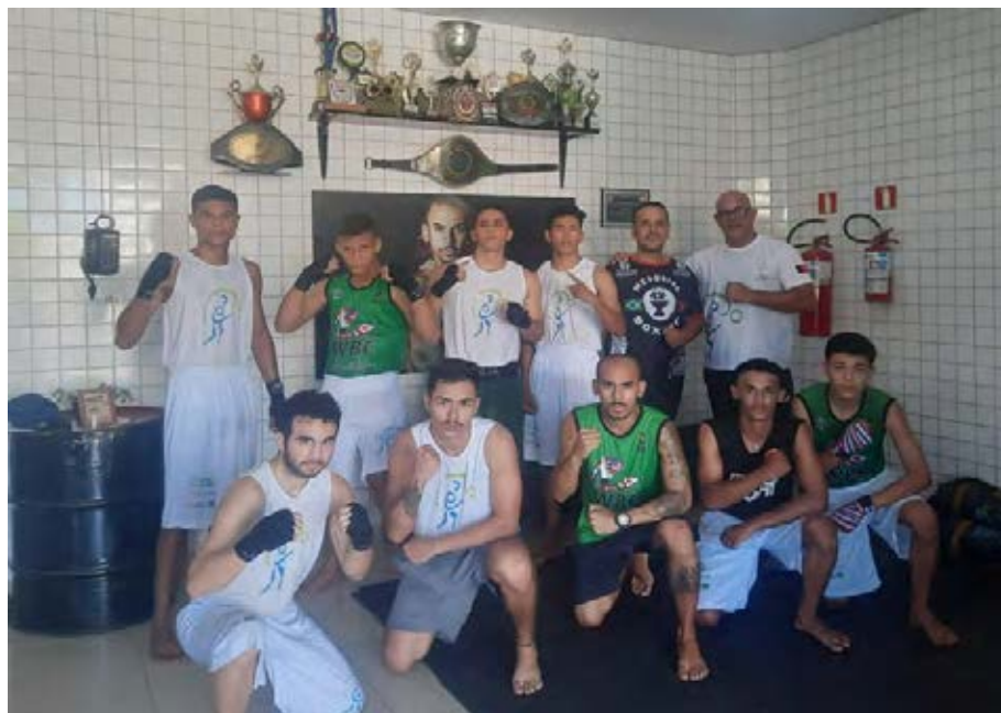
Figura 21 - Turma de Boxe