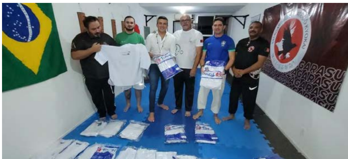
Figura 30 - Material do Karatê