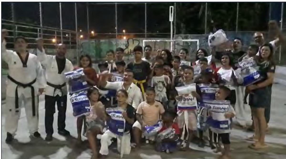
Figura 29 - Entrega do material de Taekwondo