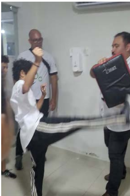
Figura 17 - Atividade de Muay-tai