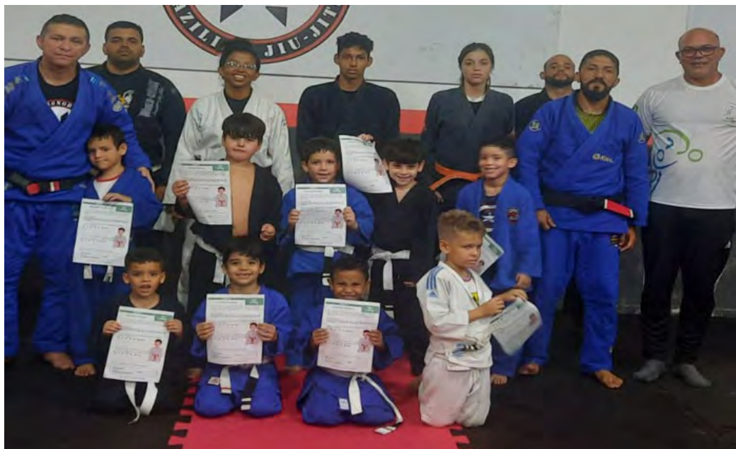
Figura 7 - Entrega de certificado de troca de faixa, turma jiu-jitsu