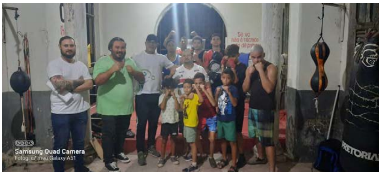
Figura 3 - Núcleo Boxe