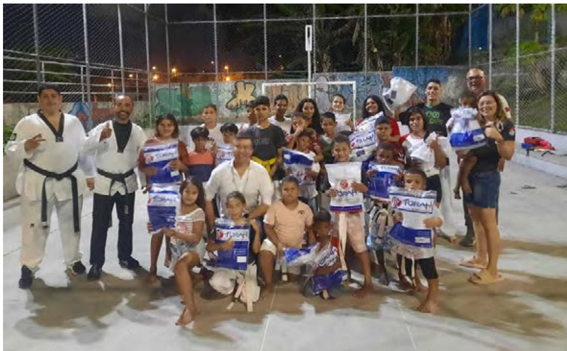
Figura 34 - Entrega material Taekwondo turma iniciante