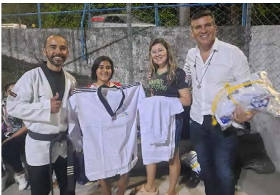
Figura 33 - Entrega material Taekwondo para alunas da equipe com maior graduação