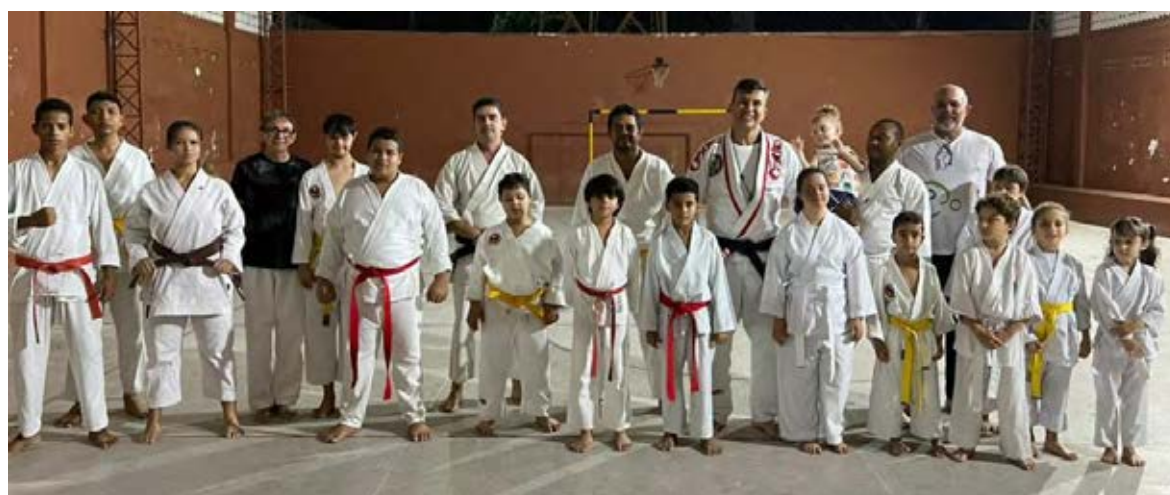
Figura 12 - Atividade turma de Karatê