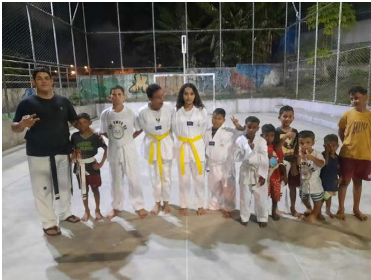
Figura 5 - Núcleo Taekwondo