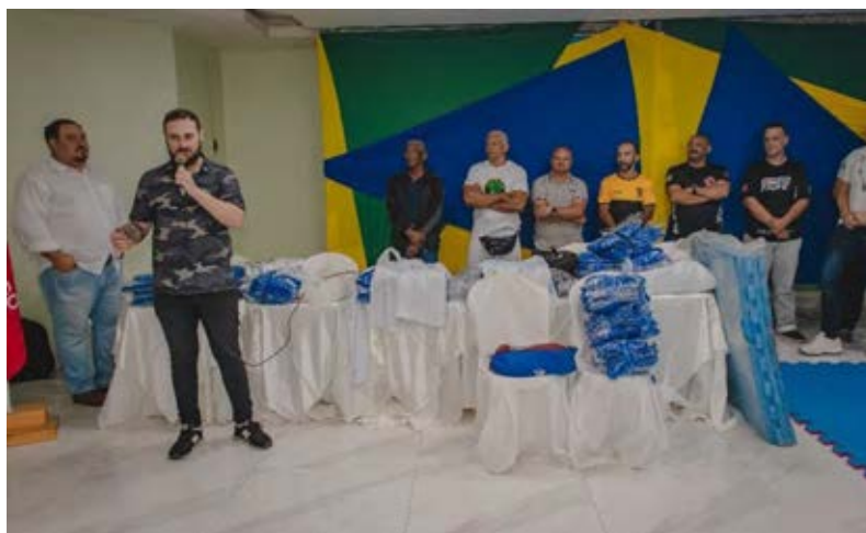
Figura 24 - Vice-presidente chamando os beneficiados para entrega do material de Jiu-jitsu