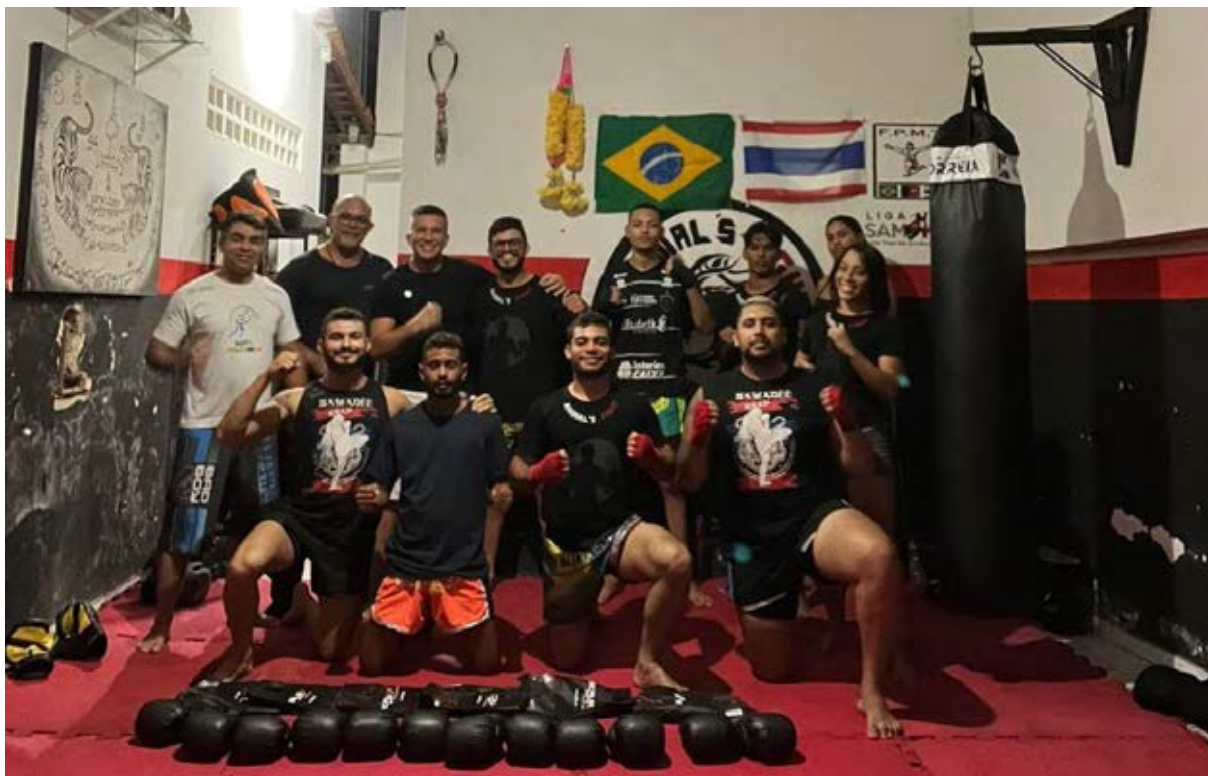
Figura 38 - Entrega material Muay-thai