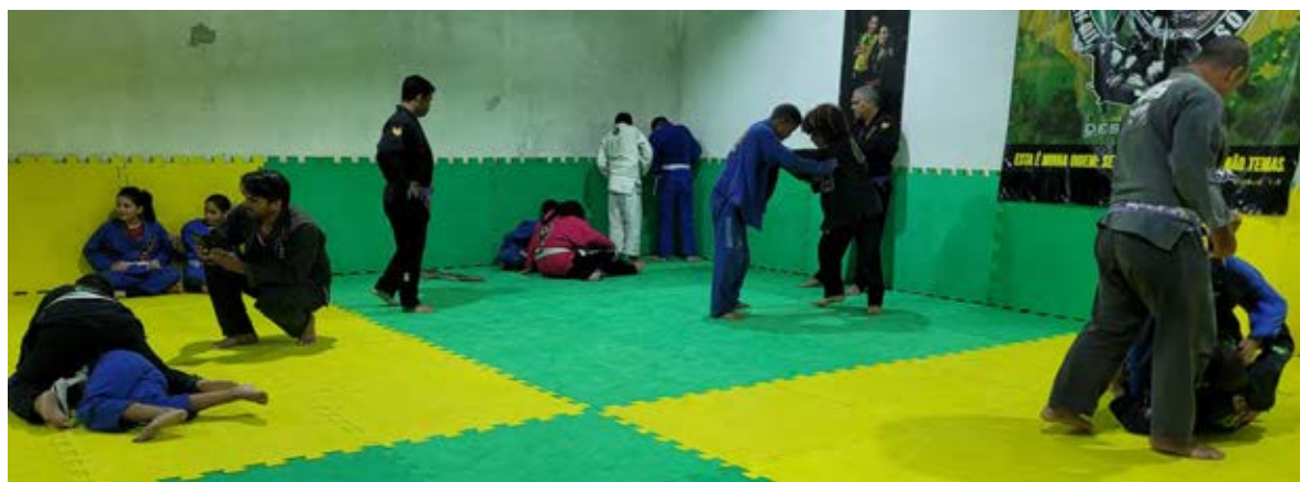
Figura 8 - Aula de Jiu-jitsu