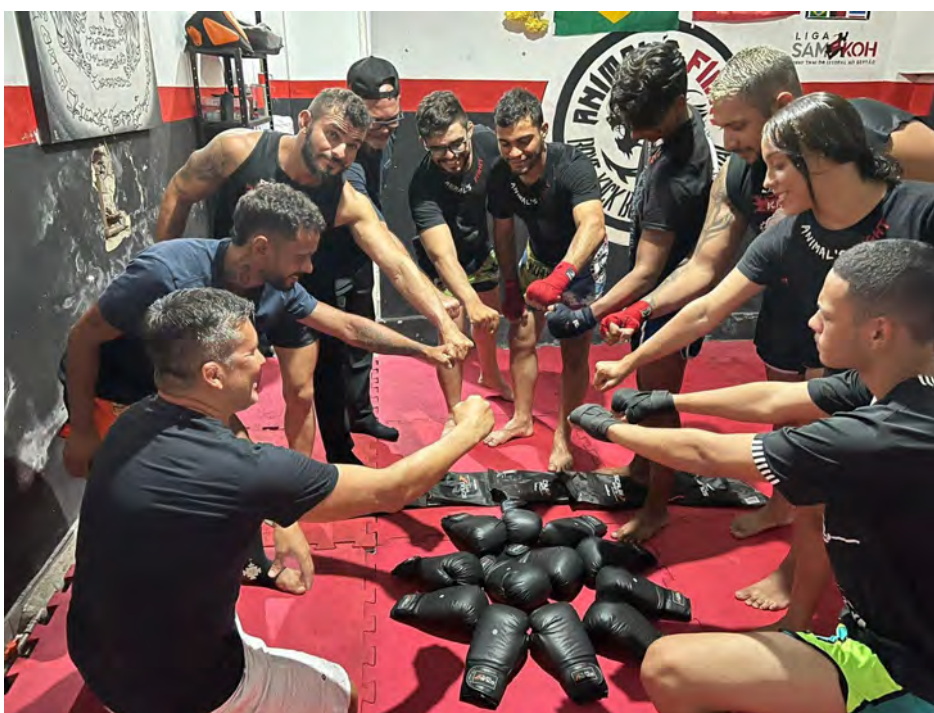
Figura 39 - Entrega material Muay-Thai