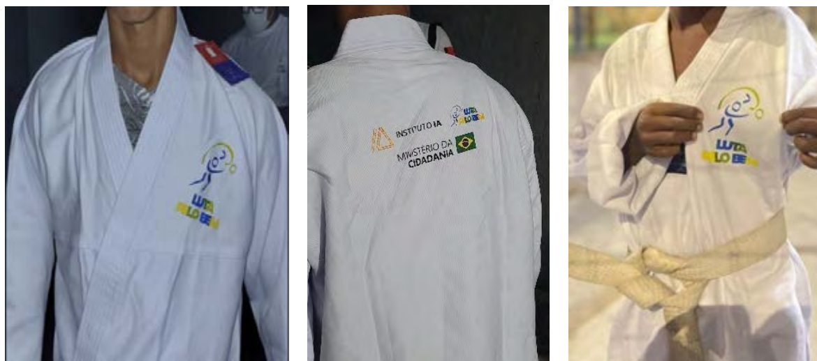
Figura 27 - Marca do projeto aplicada no material