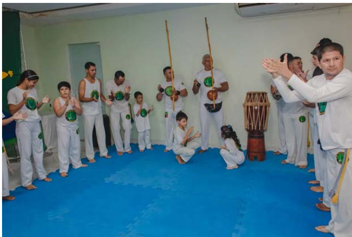
Figura 1 - Núcleo Capoeira