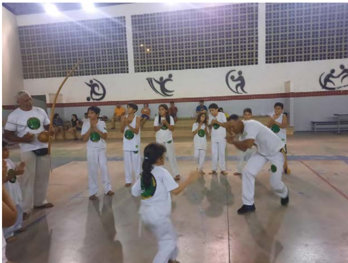
Figura 2 - Aula de Capoeira