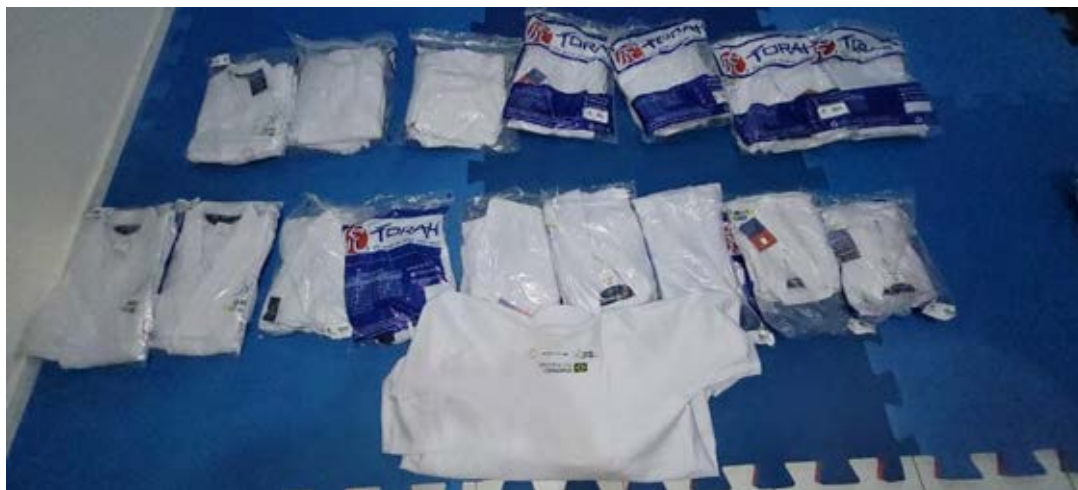
Figura 32 - Entrega de material de Karatê