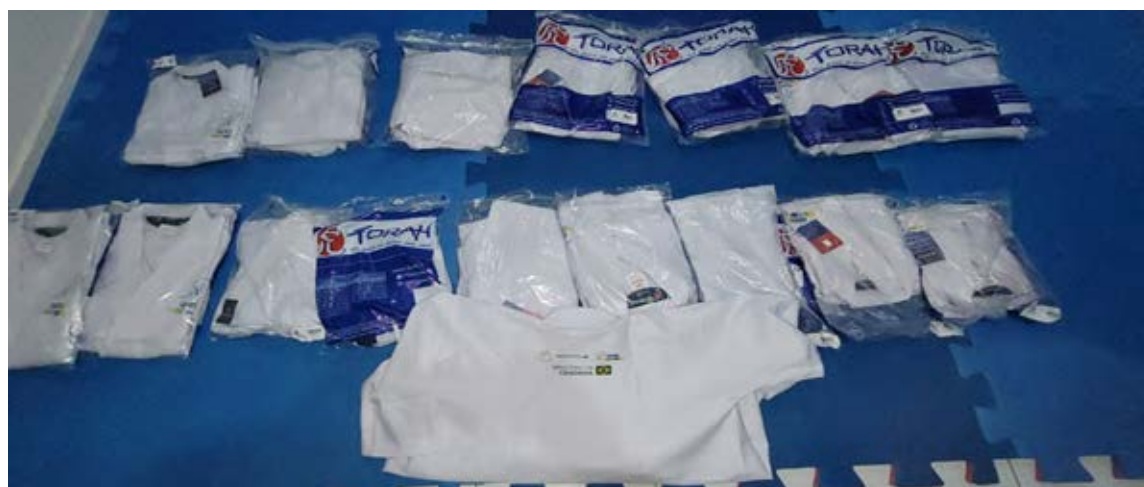
Figura 28 - Material Jiu-jitsu