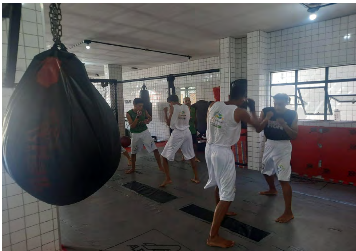
Figura 22 - Atividade de Boxe