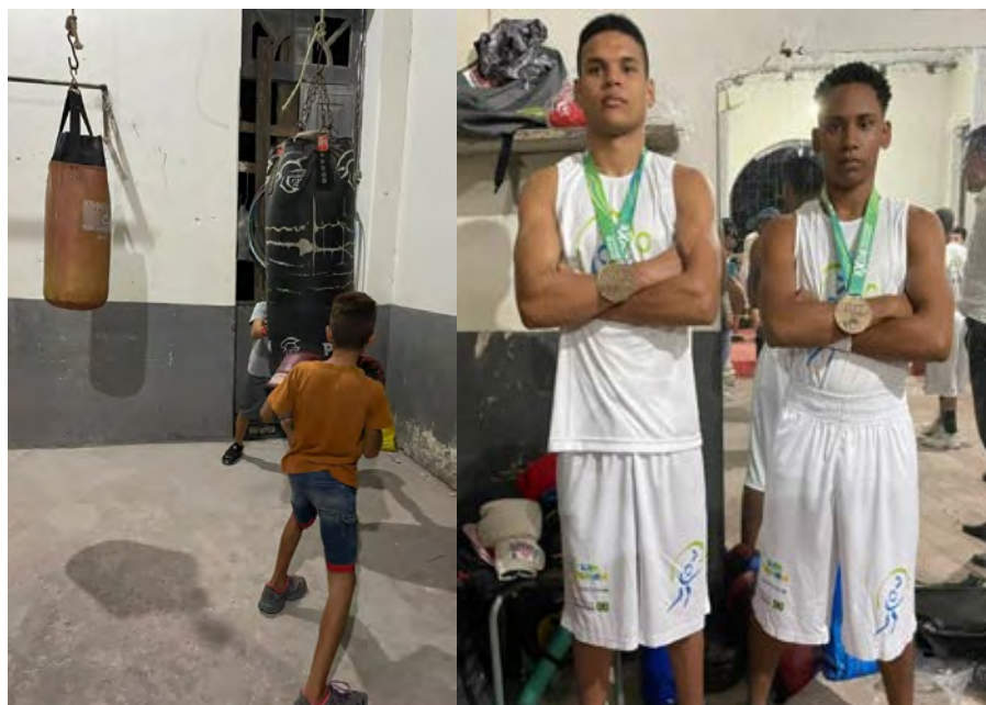
Figura 18 - Atividade de Boxe