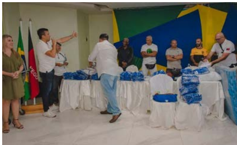
Figura 25 – Presidente entregando os materiais