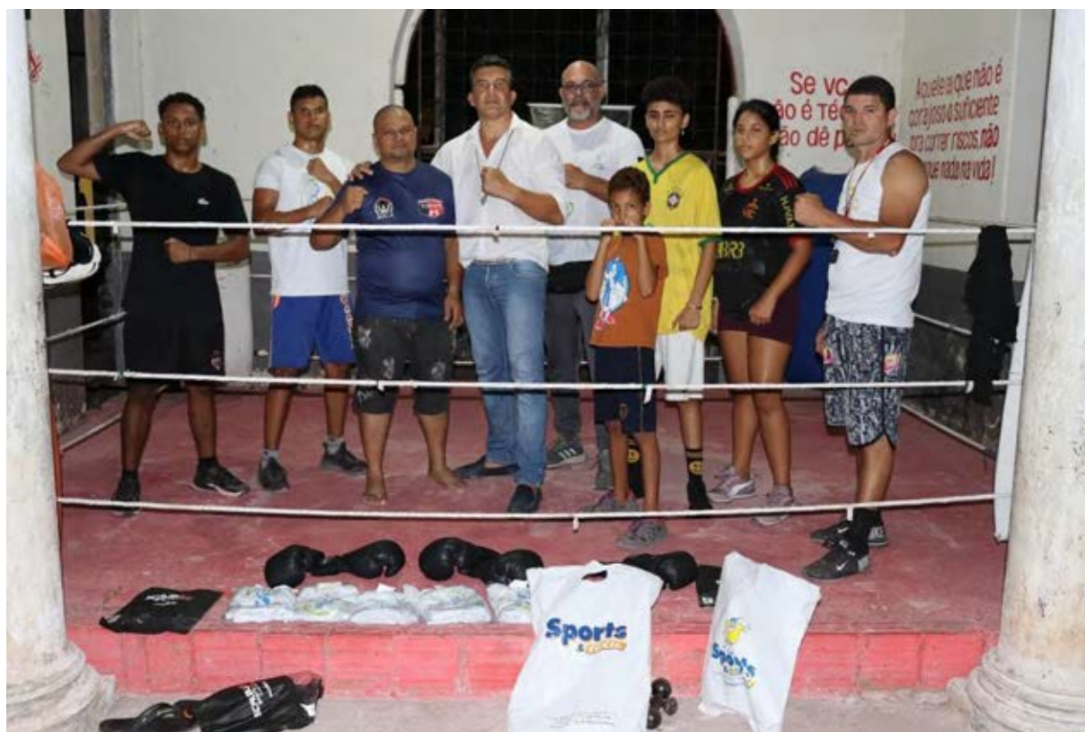
Figura 37 - Entrega material Boxe