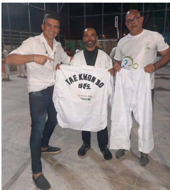
Figura 35 - Entrega de material para o instrutor de Taekwondo