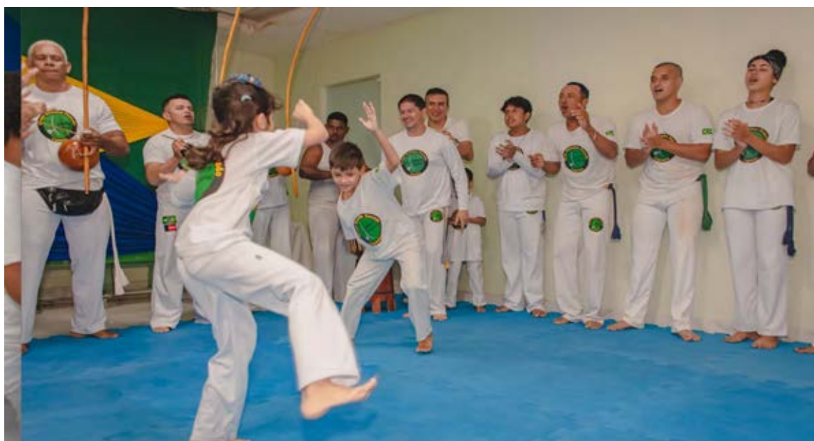
Figura 14 - Atividade de Capoeira