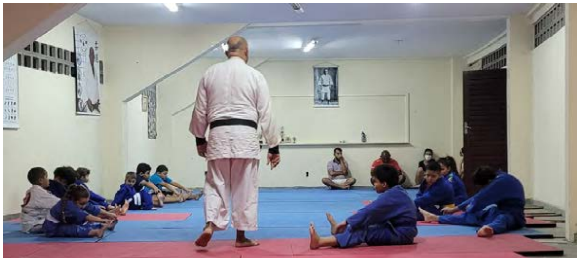
Figura 9 Atividade de Judô