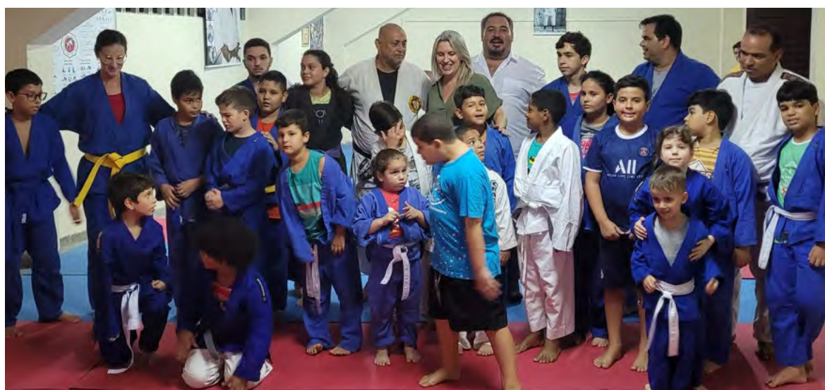
Figura 10 - Atividade de Judô