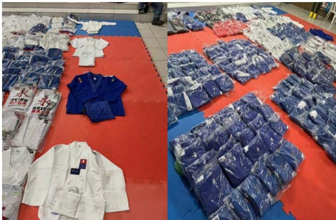
Figura 40 - Entrega material Jiu-jitsu