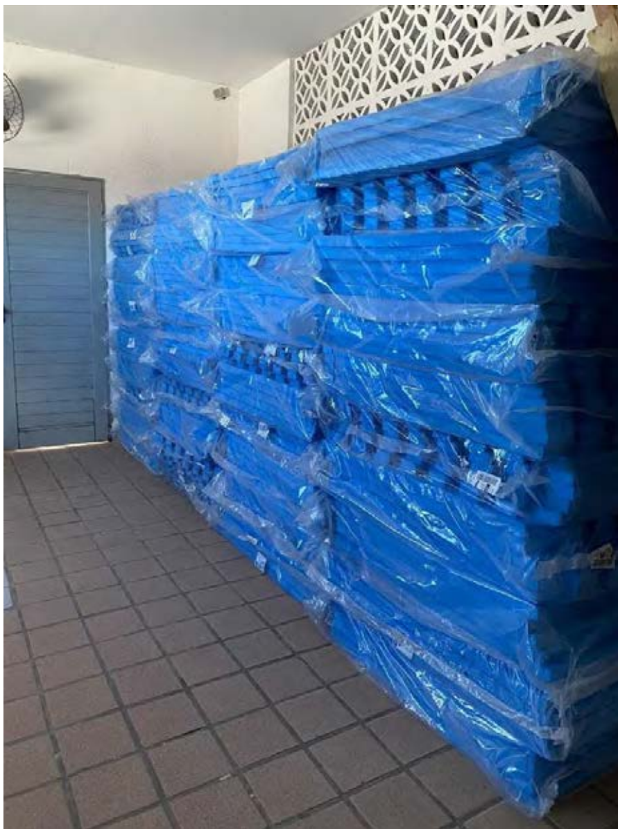
Figura 42 - Entrega Tatames