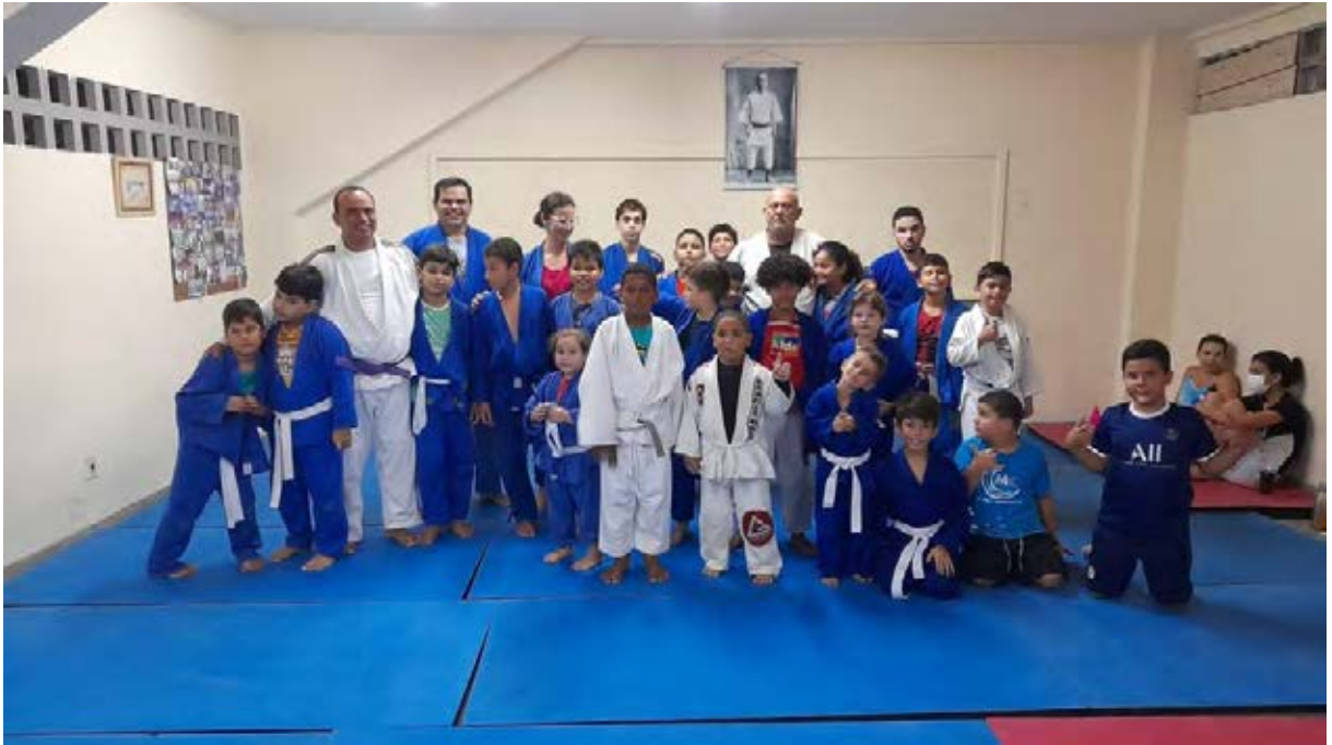
Figura 4 - Núcleo Judô