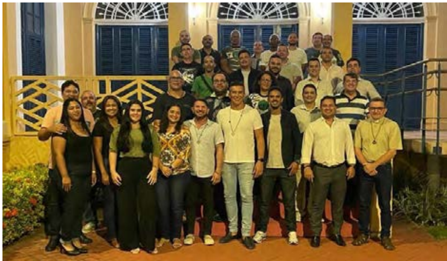
Figura 23 - 1ª Seleção da equipe do projeto