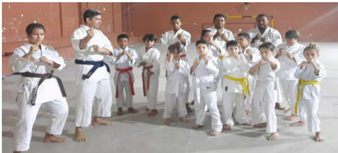
Figura 11 - Atividade Karatê