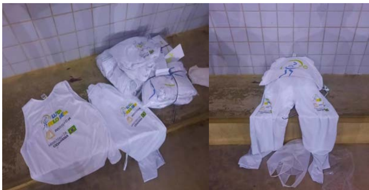
Figura 41 - Entrega das camisetas do Boxe, Muay-tai e Capoeira