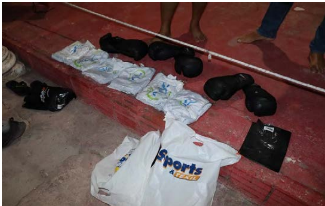
Figura 36 - Entrega de material de Boxe