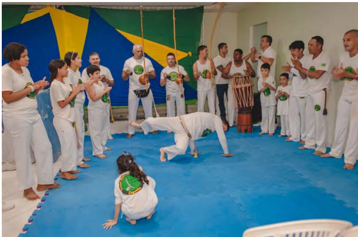
Figura 15 - Atividade de Capoeira