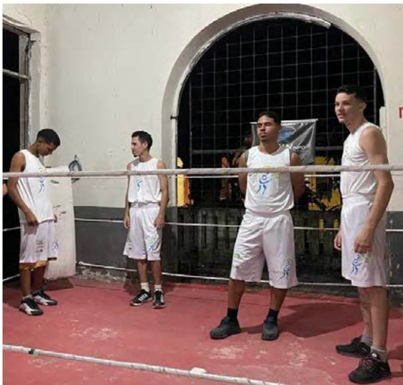
Figura 19 - Atividade de Boxe