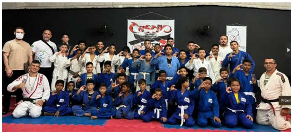
Figura 6 - Núcleo Jiu-jitsu