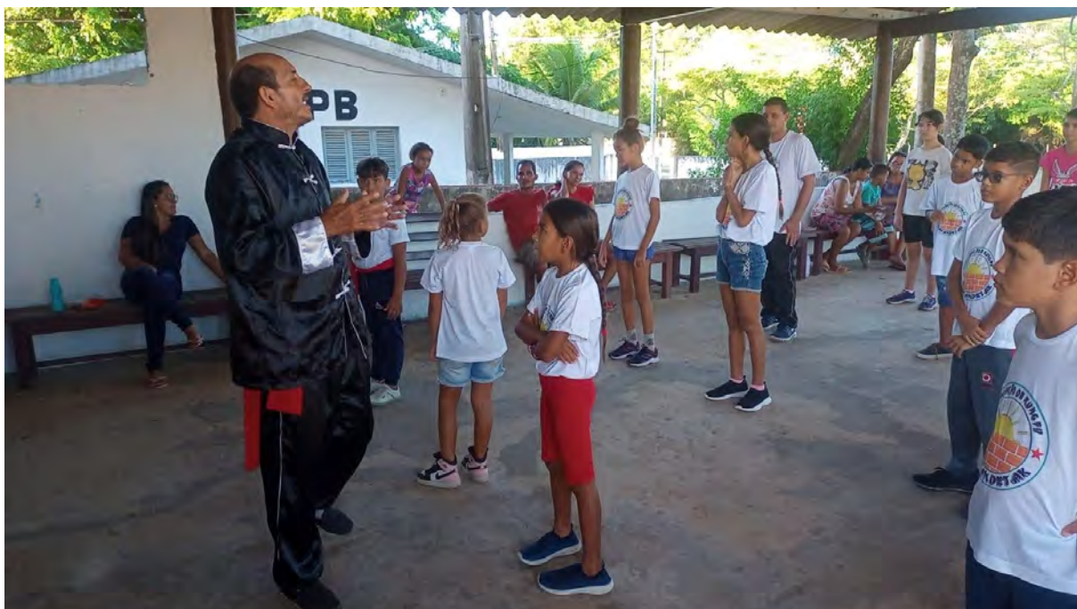
Figura 20 - Atividade de artes marciais