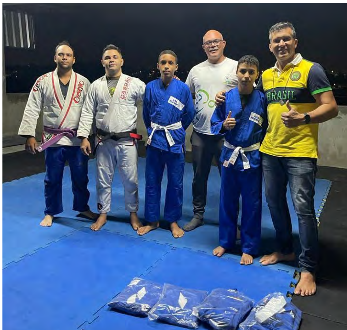
Figura 31 - Entrega de material de Jiu-jitsu turma mais graduada