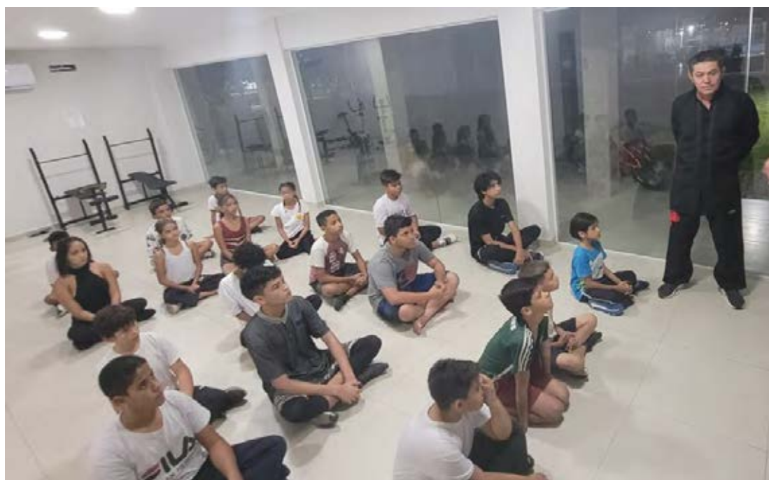
Figura 16 - Atividade de Iniciação de artes marciais – Núcleo Muay-tai