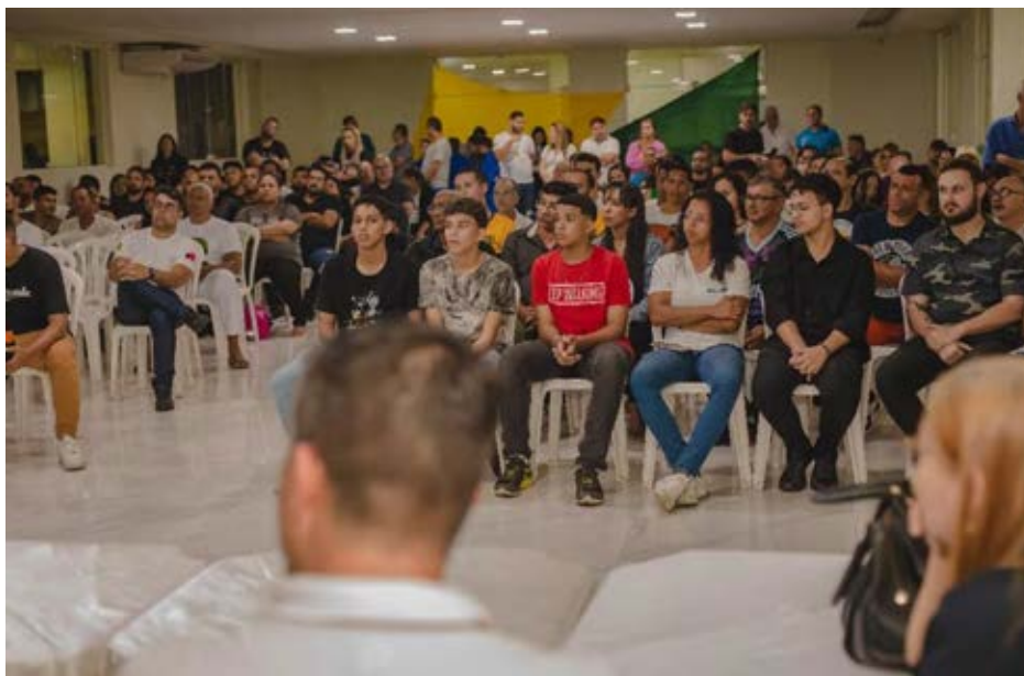
Figura 26 - Equipe de alunos, instrutores e voluntários para recebimento de materiais